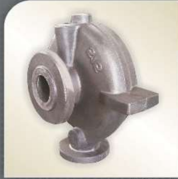
W = 300 kg

بمشاوره و بهای رقابتی و با رعایت دقیق استانداردهای ملی و بین‌المللی و با استفاده از بهترین مواد و ماشین‌آلات پیشرفته.