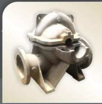
W = 5200 kg