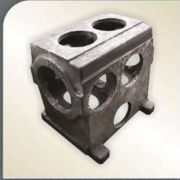
W = 200 kg