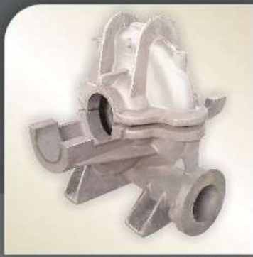
W = 800 kg